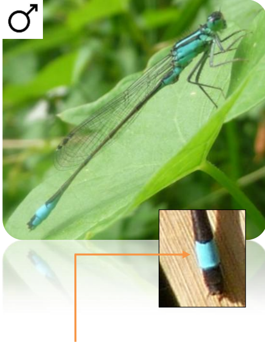
Coloration sur le 8 ème segment abdominal