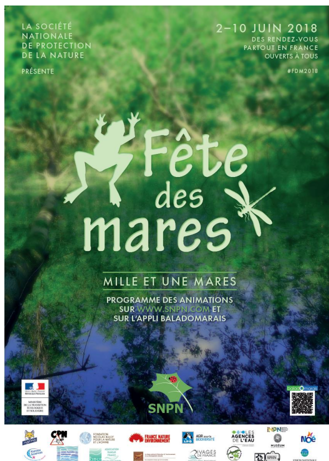
Affiche de la Fête des mares 2018 – 2 au 10 juin