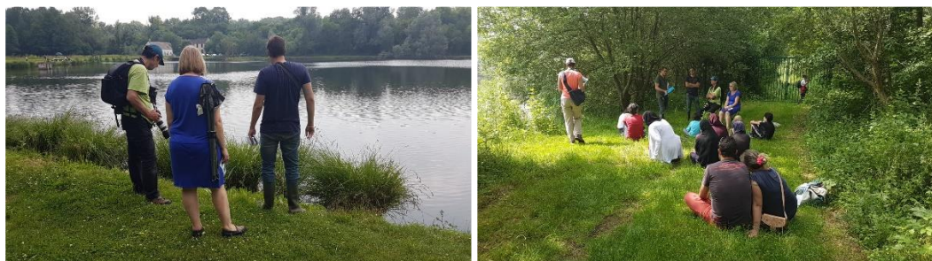
Sortie nature « A la découverte des libellules » - 09/06/18