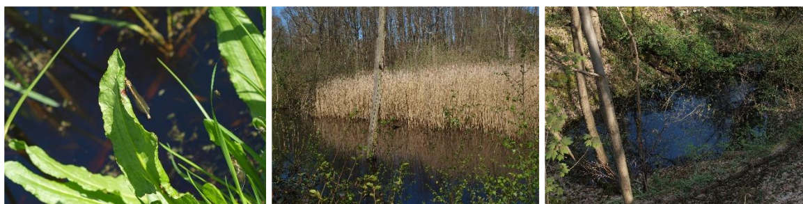
Sortie nature « A la chasse aux mares » - 03/06/18